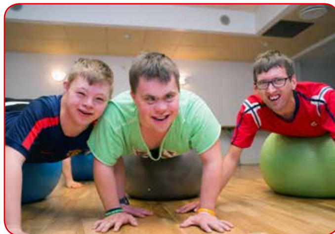
Kompiser på trening.

Fire gjester fra Os kommune var til stede som observatører under hele arrangementet. Det ga åpenbart mersmak – som i sin tur kanskje kan bety at nok et lokallag er på trappene i et av Norges desidert mest aktive fylkeslag!