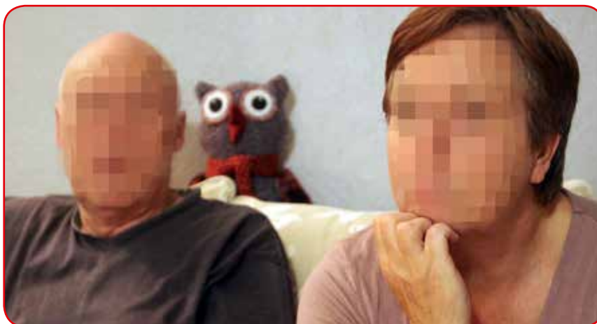
«Annes» foreldre fortvilet på datterens vegne.

Da SFA gikk i trykken, var klagen ennå ikke ferdig behandlet hos Fylkesmannen.