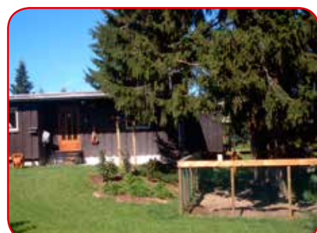
Det var en gang en svært vakker hage.