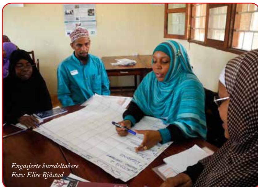
Engasjerte kursdeltakere.

tilgjengelig med råd og støtte i prosessen med å gjennomføre disse prosjektene.