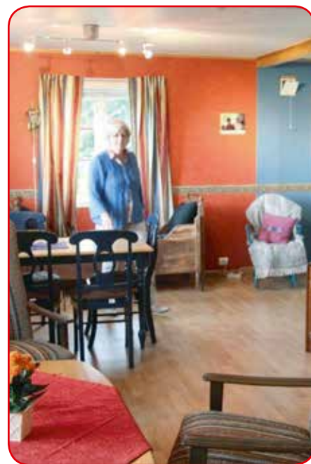
«Karls» tidligere verge argumenterte forgyves for salg av leiligheten som «Karl» eier i foreldrenes sokkeletasje. Nå vil den nåværende vergen gjøre det samme

Vedtaket innebærer kontinuerlig tilsyn døgnet rundt 365 dager i året i samme rom med fotfølging både i og utenfor bofellesskapet, skadeavvergende tiltak med (omstridt, red.anm.) bruk av mageleie, mat- og vannrestriksjoner og begrensninger med og overvåkning av telefonsamtaler. «Karl» får i tillegg totalt besøksforbud hjemme hos foreldrene. Familien må avtale besøk hos ham med personale til stede hos ham på forhånd – fortrinnsvis