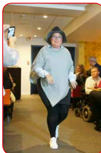
Modellene ble foreviget underveis.