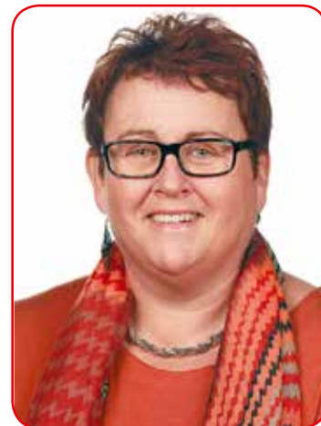
Olaug Bollestad, KrF.

-Spørsmålet om hvordan det kan sikres at vergeordningen fungerer best mulig for den vergetrengende er ikke godt nok systematisert. Det vil kreve en revidering av vergemålsloven – som for øvrig er nødvendig – på flere vis.