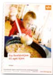
Fra foreldrehjem til eget hjem