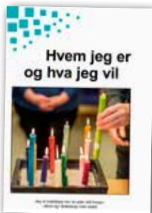
Hvem jeg er og hva jeg vil

Alle kurshefter 35,- kr per hefte (bortsett fra "Pengene mine"). Porto kommer i tillegg.