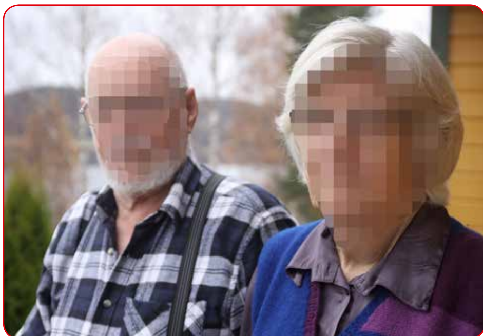
Foreldrene fortviler over all umyndiggjøringen av "Karl" som de mener opprettholder problemene og gjør ham sykere og stadig mer hjelpeløs.