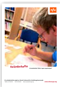
Veilederhefte til studieheftet "Aktiv i egen organisasjon"