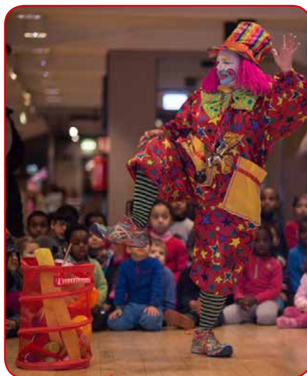
Kloven Bibis dans vakte stor jubel på barnehagedagen