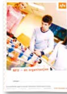
NFU - en organisasjon