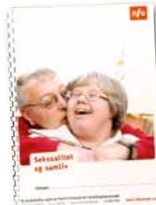
Seksualitet og samliv