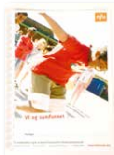
Vi og samfunnet (nynorsk)