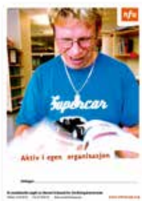
Aktiv i egen organisasjon