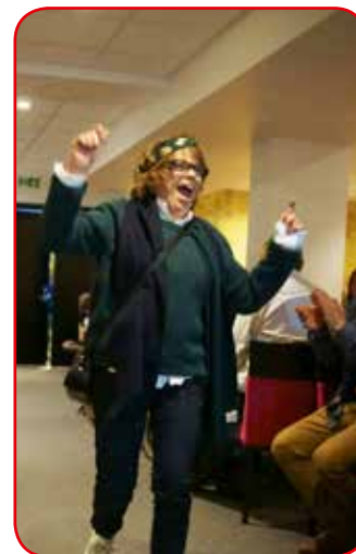
Kveldens gladeste mannekeng!