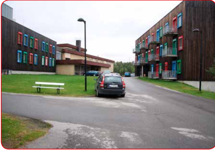
Bofellesskapet der «Anne» har bodd i seks år ligger i høyre bygg.