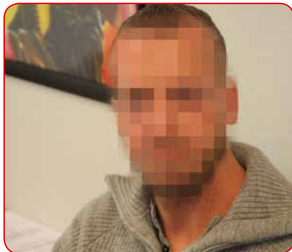
Jeg kan aldri forsones meg med at det var andre som avsluttet det på våre vegne, sier eks-samboeren.

Det verste som skjedde, var likevel da jeg ble politianmeldt av kommunen for å ha voldtatt henne. Den omfattende etterforskningen og ventetiden før det endelig ble fastslått at det ikke forelå straffbare forhold og saken ble henlagt,