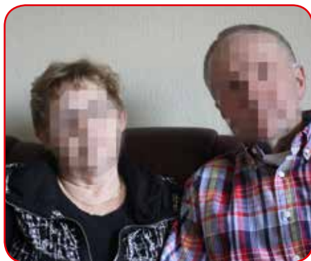
Foreldrene frykter at tvangsvedtaket forlenges.

Foreldrene orker ikke å tenke på at tvangsvedtaket kan bli forlenget når det nå skal opp til ny vurdering. De gjør alt de kan for å hjelpe datteren gjennom sin advokat. Begge føler seg maktesløse overfor den massive taushetsmuren i systemet rundt henne – som har tatt hele styringen over hennes liv. - Fagfolkene som har med «Else» å gjøre har aldri tatt initiativ til dialog med oss. Vi har heller aldri fått vite hvorfor de mener at samvær med og kontakt med oss er til «vesentlig skade» for datteren vår. Det er også svært vanskelig å forholde seg til, sier foreldrene.