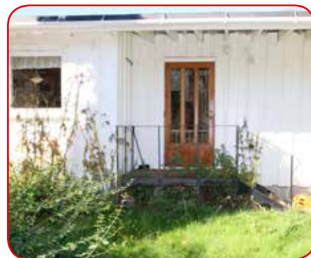
August 2015: Hagen var et villnis og kjøkken-trappen i ferd med å gro helt igjen.