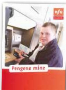
Pengene mine kr. 75,-