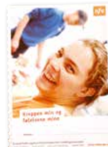
Kroppen min og følelsene mine