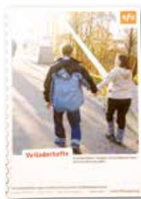
Veileder til kurslærer