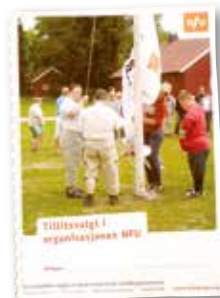
Tillitsvalgt i organisasjonen NFU