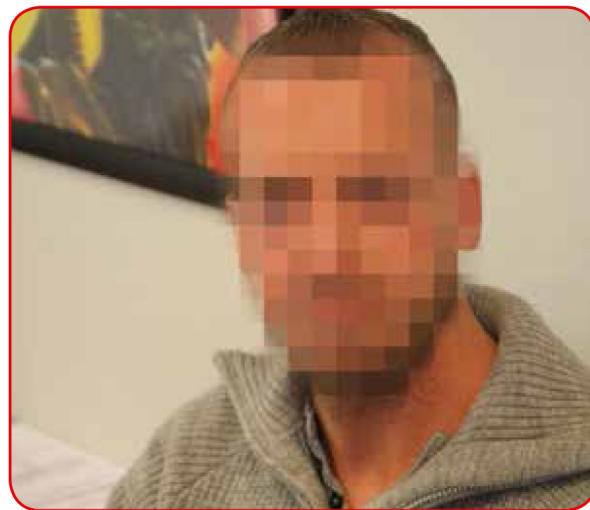
Jeg kan aldri forsones meg med at det var andre som avsluttet det på våre vegne, sier eks-samboeren.

Det verste som skjedde, var likevel da jeg ble politianmeldt av kommunen for å ha voldtatt henne. Den omfattende etterforskningen og ventetiden før det endelig ble fastslått at det ikke forelå straffbare forhold og saken ble henlagt,