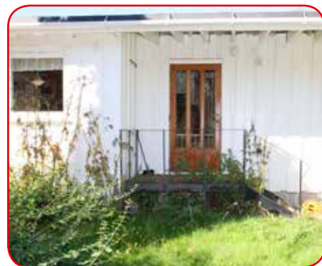
August 2015: Hagen var et villnis og kjøkken-trappen i ferd med å gro helt igjen.