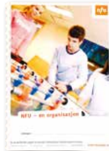
NFU - en organisasjon