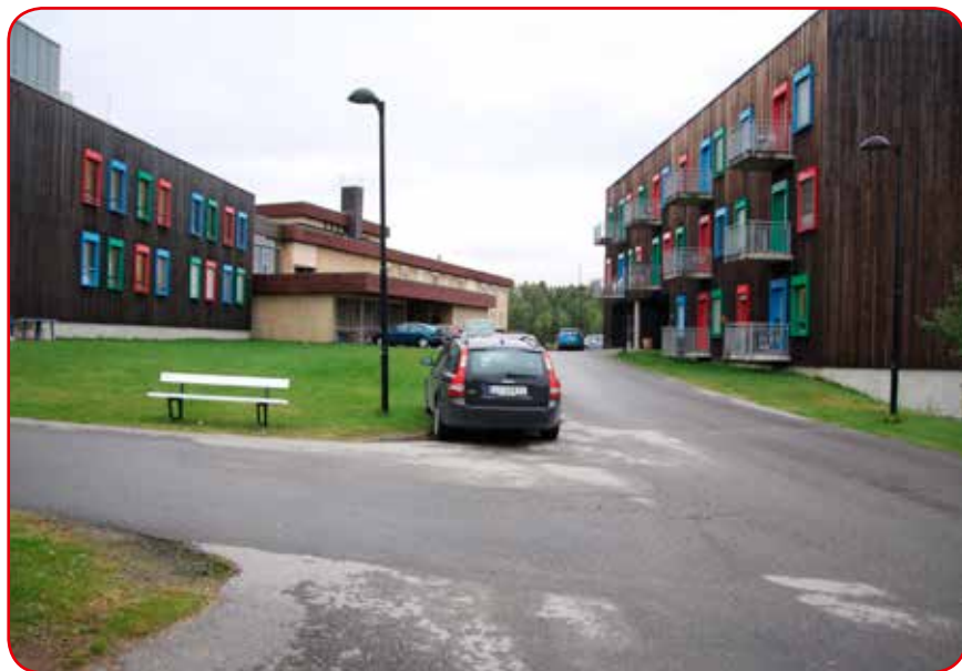
Bofellesskapet der «Anne» har bodd i seks år ligger i høyre bygg.