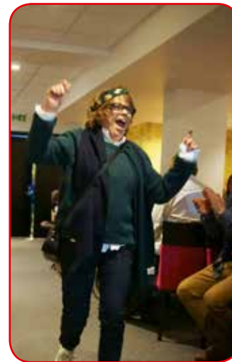
Kveldens gladeste mannekeng!