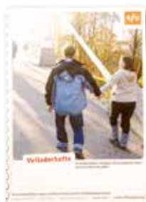
Veileder til kurslærer