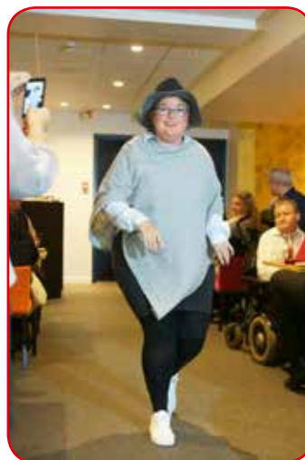
Modellene ble foreviget underveis.