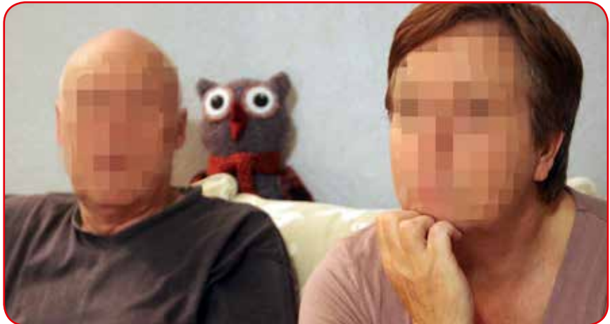
«Annes» foreldre fortvilet på datterens vegne.

Da SFA gikk i trykken, var klagen ennå ikke ferdig behandlet hos Fylkesmannen.