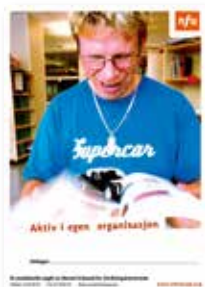
Aktiv i egen organisasjon