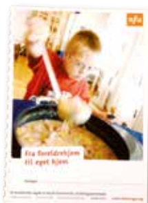
Fra foreldrehjem til eget hjem